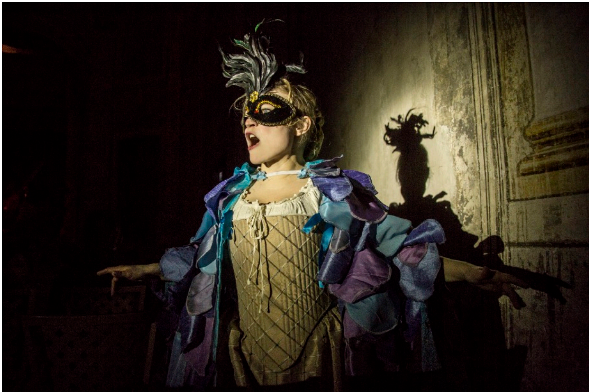
Ur föreställningen Sångfågeln.

Även om du som lärare har ansvaret för din klass ska du tillåta dig att njuta av pjäsen som publik. Det som kan verka som oro och prat bland eleverna kan vara inlevelse och engagemang, känslor och reaktioner på det som pågår på scenen. Artisterna är vana vid det och arbetar med att ta in det i föreställningen. Om du som lärare vet att någon eller några i klassen behöver stöd, så kan du tänka på hur eleverna är placerade under föreställningen och även hur ni lärare sitter. Vår erfarenhet säger oss att bäst atmosfär får man om skådespelare och lärare samarbetar och "känner in" om någon går över gränsen.