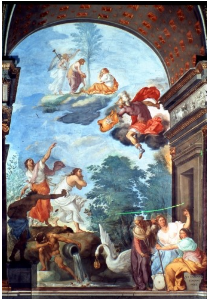
Väggmålning i Palazzo Pitti i Florens. Konstnär: Francesco Furini.