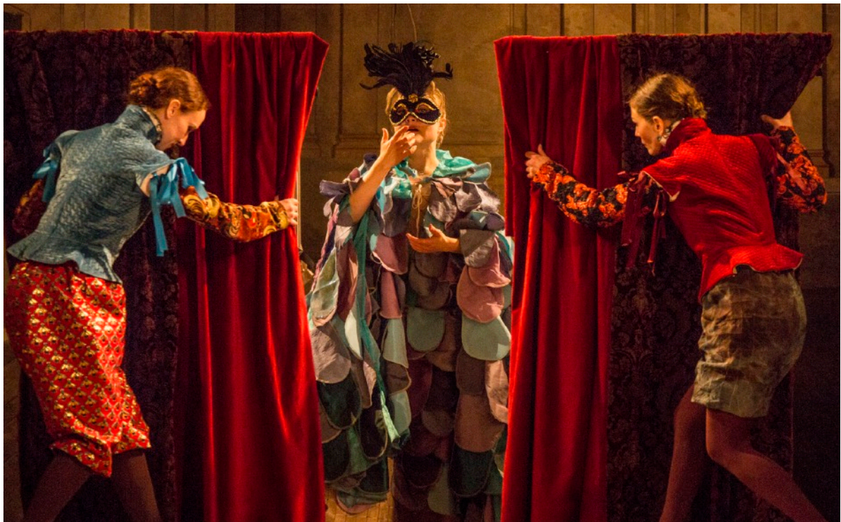
Ur föreställningen Sångfågeln.

•Låt nu barnen gå in i ett skapande. Sätt på Spotify-listan och låt den rulla. Tillåt dem att skriva ner ord som kommer upp, meningar, att måla en känsla som de känner när de hör musiken, rita en teckning av vad de tror att musiken handlar om. Samla sedan in teckningarna, orden, meningarna. Nästa dag kan du tex ha ett vernissage med deras alldeles egna 1600-talsutställning, eller varför inte till nästa föräldramöte!