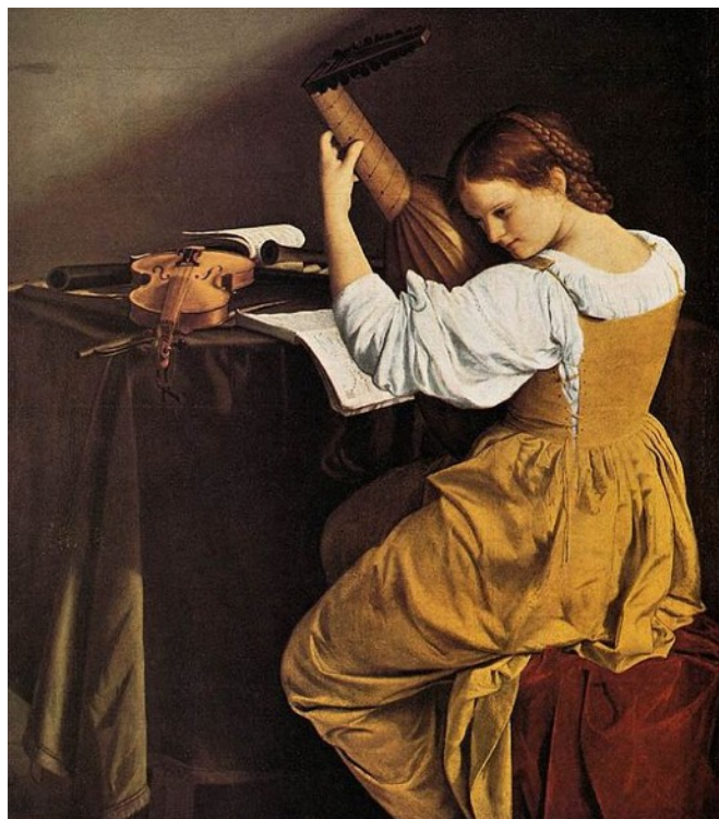
Orazio Gentileschi, "Lutspelerskan" c. 1612-1620. National Gallery of Art. Porträttet tros föreställa Francesca Caccini.