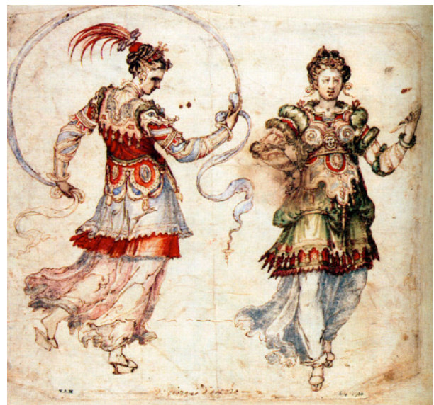
Två dansare i "La Pellegrina" som framfördes 1589 då Christine de Lorraine gifte sig med Ferdinand de' Medici.