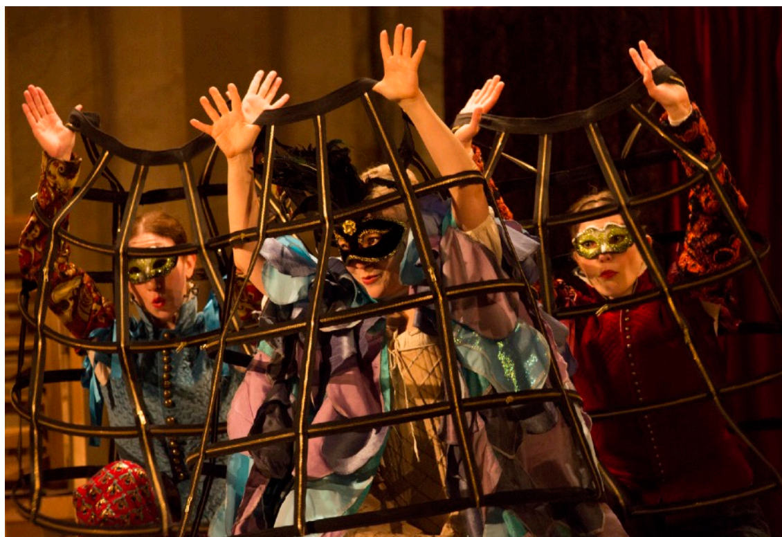
Ur föreställningen Sångfågeln.

Förklara för barnen att sångerna i föreställningen är skriven av Francesca Caccini, och att det är sant att de mesta av hennes musik inte finns kvar. All musik ni hörde och dansen ni såg är från 1600-talet. På så vis gjorde ni en verklig tidsresa!