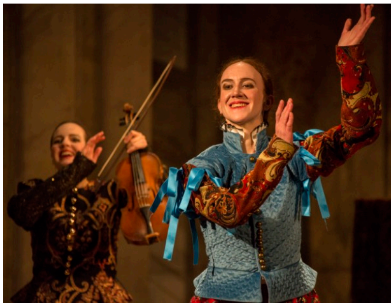
Ur föreställningen Sångfågeln.